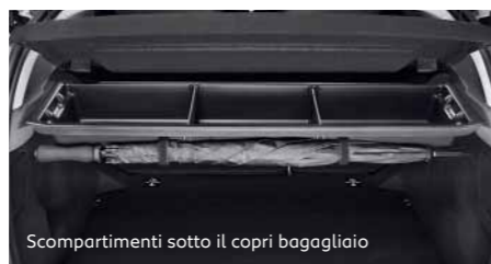
Scompartimenti sotto il copri bagagliaio