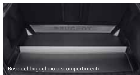
Base del bagagliaio a scompartimenti