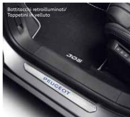
Batticchi retroilluminati/ Tappetini in velluto