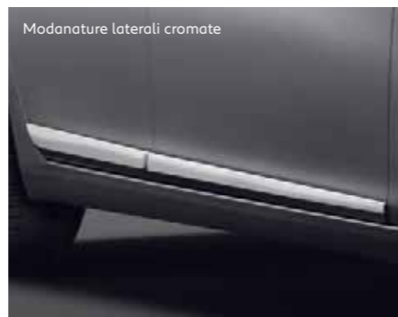
Modanature laterali cromate