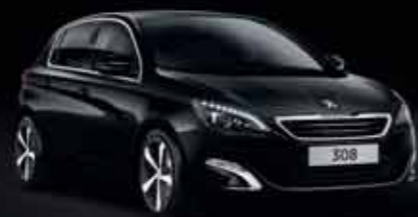
Nero Perla Nera*