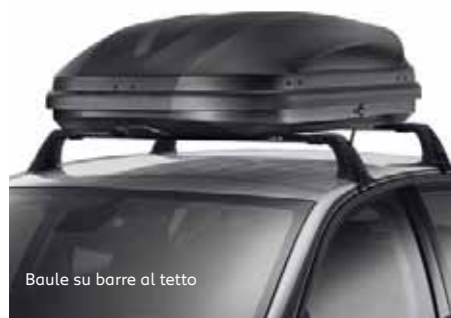
Baule su barre al tetto