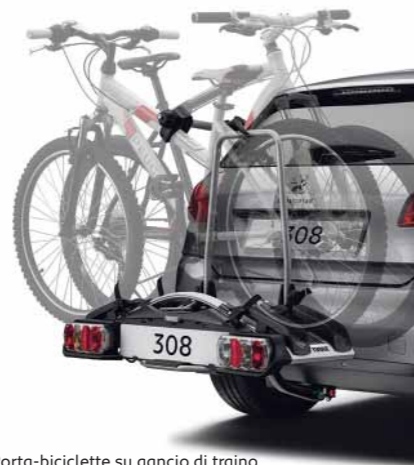
Porta-biciclette su gancio di traino smontabile senza l'uso di attrezzi